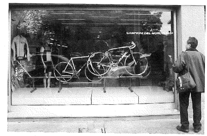
De Rosa 本社工場のウィンドウディスプレイ。後姿は筆者

そのとき訪れた世界的自転車メーカー“De Rosa”（写真/高級ロードレーサーを製造する自転車メーカーで高いものでは300万円もする）では、家内工業的に大変丁寧な自転車の製造が行われていた。世界のトップレーサーから愛される自転車を産み出すことで、当然レーサーたちと